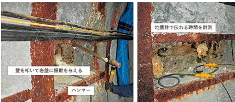
写真 ハンマーで壁を叩いて振動する波を発生させている様子（左）と、波が伝わる時間を測定している様子（右）

ぜひ一度、センターまで見学にいらしてください。（※地下坑道の見学は指定日の予約制です） 来月は、人工バリアについてご紹介します。